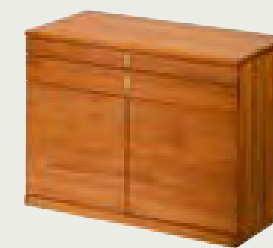
CSEK 100Q (quadrat)